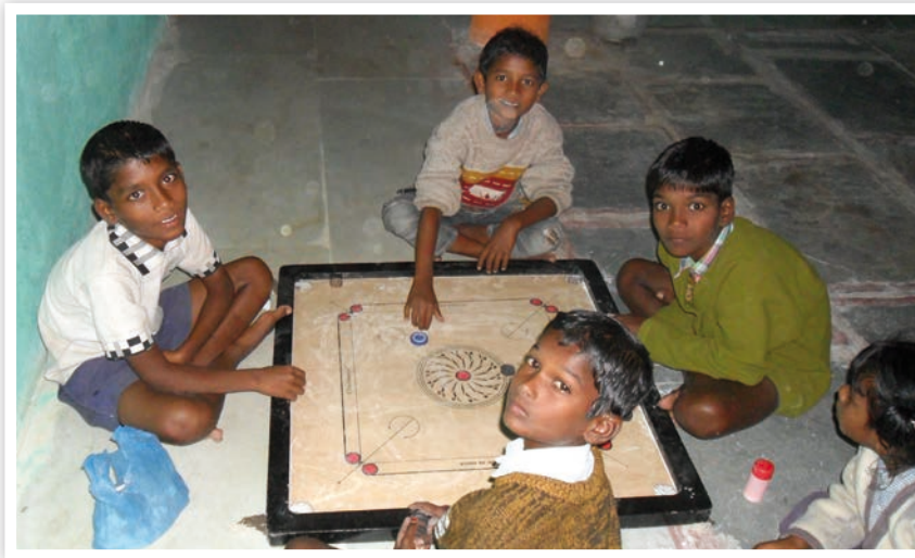
Børnene på børnehjemmet i Gudipadu er glade for deres nye hjem, som giver god plads til leg