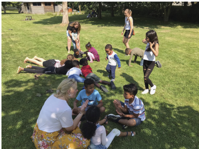
Både børn og ledere får en oplevelse for livet, når de er på tværkulturel lejr i Børkop.

- Så dur det heller ikke, at vi anvender et indforstået kristent sprog. Hvis vi