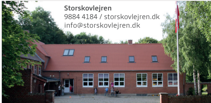
Storskovlejren 9884 4184 / storskovlejren.dk info@storskovlejren.dk